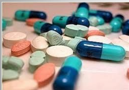
Oncologia Medica (Dott. S. Pisconti)