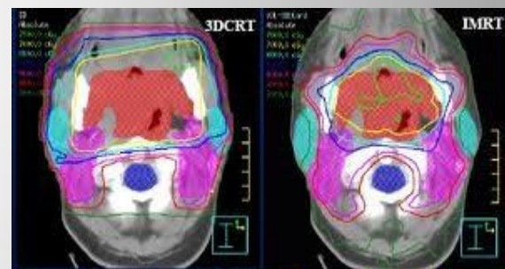
Radioterapia Oncologica (Dr. G. Silvano)

Attualità nella terapia integrata locoregionale delle neoplasie delle vie aeree digestive superiori" - Taranto 12-14 gennaio 2012 Grand Hotel Delfino